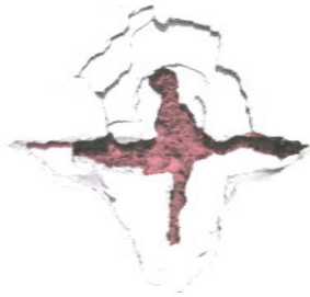
оксана забужко найдовша подорож

Новий роман Ганни Городецької "Інклюзія" розповідає історію київської вечірньої школи, куди потрапляють люди зі складною долею: біженці, сироти, алкозалежні. У кожного з них у минулому – білі плями, у шафах – скелети, а на думці – щасливе життя.