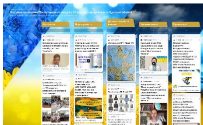
Мал. 2. Дошка «Відеоматеріали»