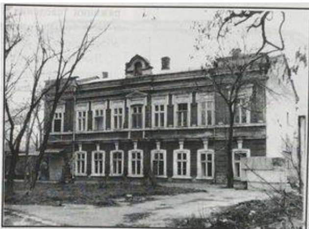
Второй причтовый дом Михайловской церкви постройки 1882 г. Фото 1996 г.

Як повідомляється в урочистому звіті до 25-річчя заснування Одеської Михайлівської однокласної церковно-парафіяльної школи (1915 р), за роки діяльності у школі навчались 657 хлопчиків та 526 дівчат, з них склали іспити відповідно 15,2% і 17% (дівчатка вчилися трошки краще за хлопців). Поряд та на недалекій відстані від школи знаходилося декілька безоплатних народних училищ, однак