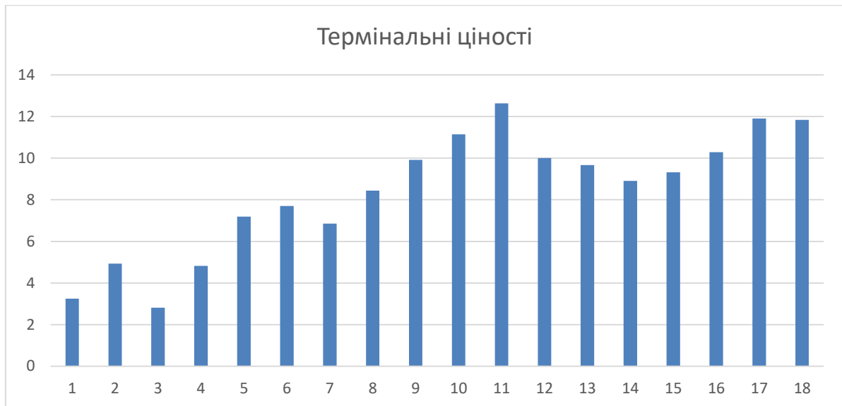
Рис. 3.1. Рівні розвитку термінальних цінностей у учнів 5-х класів

Примітка. Умовні скорочення: 1 - активна діяльна життя (повнота та емоційна насиченість життя); 2 - життєва мудрість (життєвий досвід людини); 3 - здоров'я (фізичне і психічне); 4 - цікава робота; 5 - краса природи і мистецтва ; 6 - любов (духовна і фізична близькість з коханою людиною); 7 - матеріально забезпечене життя (наявність грошей у людини); 8 - наявність хороших і вірних друзів; 9 - суспільне покликання (повага всіх людей); 10 - пізнання (можливість побачити світ ); 11 - продуктивне життя (максимально повне використання своїх можливостей, сил і здібностей); 12 - розвиток (робота над собою, постійне фізичне і духовне вдосконалення); 13 - розваги (приємне, необтяжливе проведення часу, відсутність обов'язків); 14 - свобода (самостійність, незалежність у судженнях і вчинках); 15 - щасливе сімейне життя; 16 - щастя інших (добробут, розвиток і вдосконалення інших людей, всього народу, людства в цілому); 17 - творчість (можливість творчої діяльності); 18 - впевненість у собі (внутрішня гармонія, свобода від внутрішніх протиріч; сумнівів).