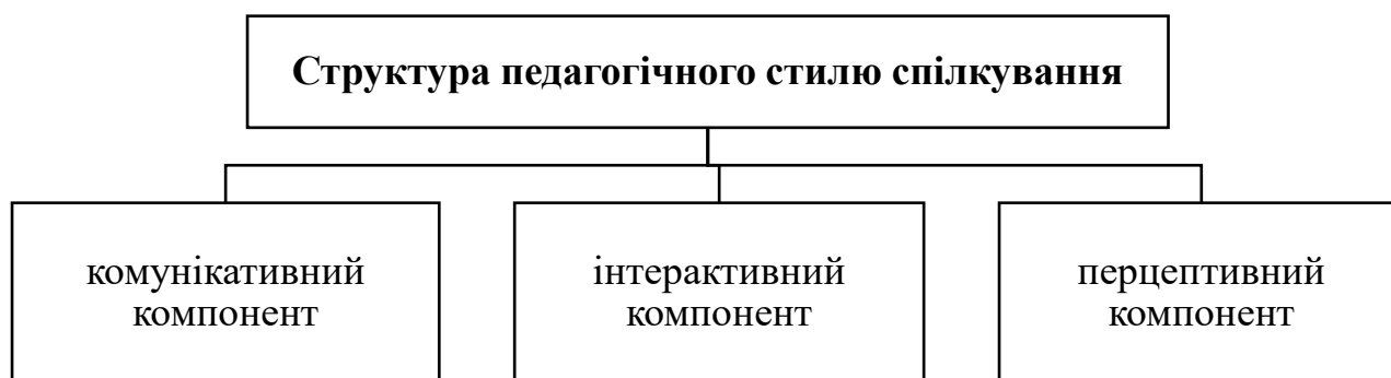
Рис. 1.2. Структура педагогічного стилю спілкування вчителя як виду діяльності

Комунікативний компонент педагогічного стилю спілкування є процесом своєрідного обміну науковою / навчальною інформацією а також думками, інтересами, почуттями між суб'єктами спілкування (вчитель-учні, вчитель-вчитель, вчитель-педагогічний колектив). Провідна роль у вербальній комунікації належить усному мовленню: монологу (усна мова, що використовується педагогом у формі пояснення, доповіді, розповіді, бесіди) та діалогу (мовленнєве спілкування двох або кількох суб'єктів) [10].