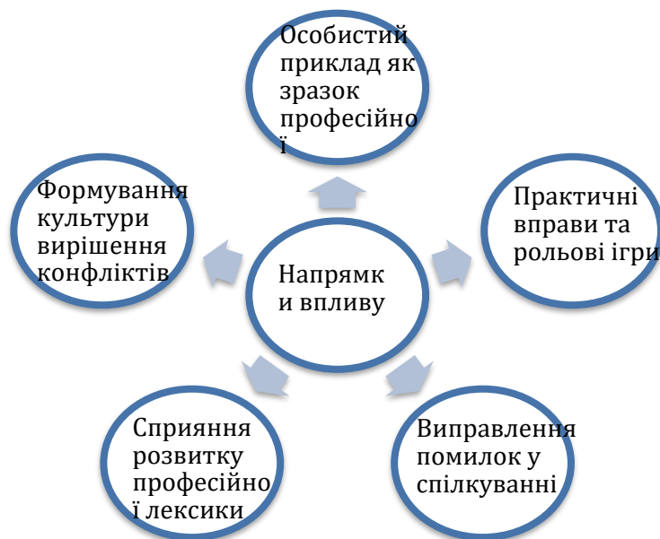
Рис. 2. Напрями впливу майстра виробничого навчання на формування професійної комунікативної культури у здобувачів освіти

2. Практичні вправи та рольові ігри. Відпрацювання професійних комунікативних навичок в умовах, що максимально наближені до реальних робочих ситуацій, відбувається під час проведення майстром занять з виробничого навчання. Зокрема, проведення рольових ігор, в яких здобувачі освіти відпрацьовують виконання функціональних обов'язків адміністратора під час взаємодії з відвідувачами або клієнтами, використовуючи методи активного слухання або інші методи ефективної комунікації. Такі вправи сприяють не лише розвитку комунікативних здібностей, але й допомагають учням навчитися контролювати свої емоції та адаптувати манеру спілкування відповідно до обставин.