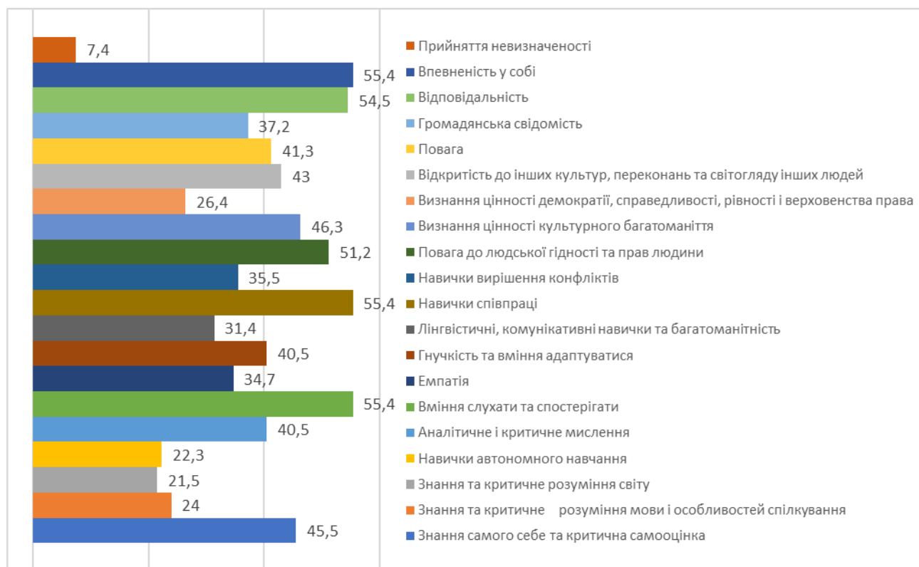
Рис.1. Потенціал позашкільної освіти щодо розвитку у вихованців компетентностей для культури демократії

На цій основі можемо стверджувати, що працівники системи позашкільної освіти, розуміючи існуючі запити суспільства щодо необхідності посилення громадянської освіти в певних її ключових тематичних сферах, чітко усвідомлюють, яку роль відіграє у цьому процесі позашкільна освіта. Підтвердженням цієї думки, є твердження респондентів з приводу того, що позашкільна освіта може посприяти досягненню цілої низки завдань громадянської освіти, серед яких формування громадянської (державної), національної та культурної ідентичності (73,6%), формування поваги до честі та гідності людини, до прав та свобод людини, здатність їх захищати (66,9%), сприяння розвитку української мови, підвищення духовного рівня Українського народу та усвідомлення його моральних норм (61,2%), впровадження принципів солідарності та турботи про спільне благополуччя (59,5%), формування навичок конструктивної міжособистісної та суспільної взаємодії,